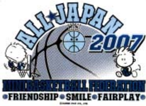
白地Tシャツデザイン